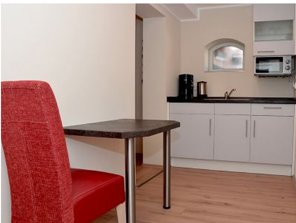
Miniküche im Vorraum