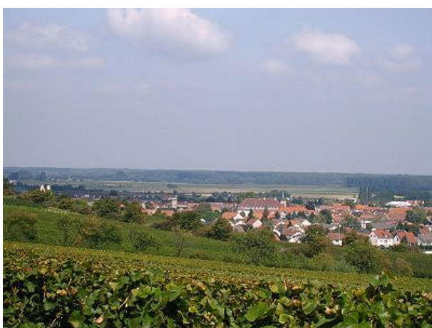
Blick auf Guntersblum