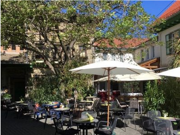
Innenhof zur Straußwirtschaft