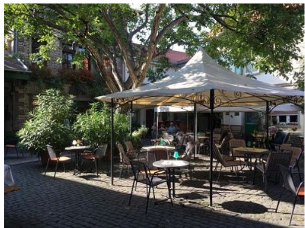
Innenhof zur Straußwirtschaft