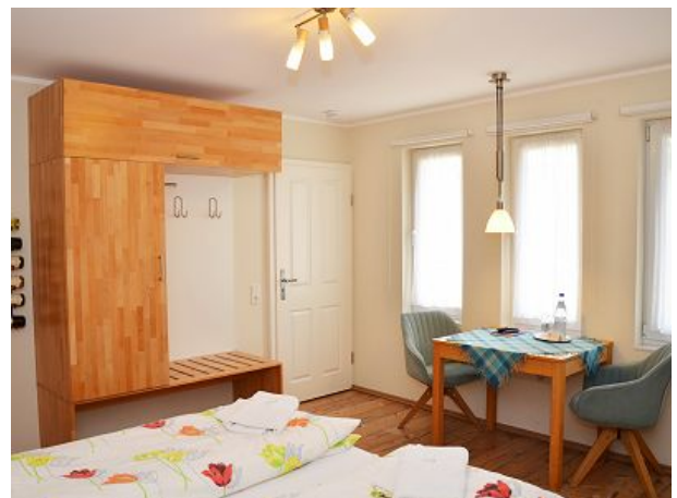
Eingang und Schrank mit Garderobe