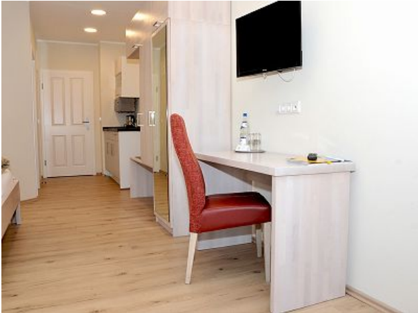
Eingang Miniküche Schreibplatz